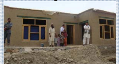
日本政府支援事業「コミュニティ主体の生活インフラ・居住環境整備を通じた平和構築事業においてジャララバード近郊に建設された住宅(アフガニスタン) 上：建設前、下：建設後