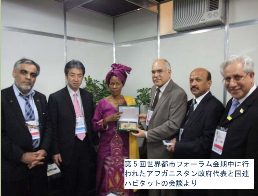
第5回世界都市フォーラム会期中に行われたアフガニスタン政府代表と国連ハビタットの会談より