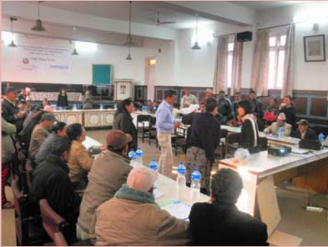
ネパールにおける自治体職員のための 廃棄物研修の様子

国際環境技術専門家会議は、2009年10月28日-29日の2日に渡って福岡市で開催されました。第1回となる今回の会議では、環境分野の中でも特に「廃棄物」（28日）と「水・衛生」（29日）について、それぞれ議論されました。第1日目の「廃棄物」については、自治体による先進的な取り組み事例として福岡市より「福岡方式」（準好気性廃棄物埋め立て）について基調プレゼンテーションが行われました。その後、中国、インドネシア、モンゴルなどアジア地域の参加国からそれぞれの国・都市の廃棄物の現状と課題、具体的に求められる技術等について説明が行われました。続いて、日本の中でも今回は特に九州地域における環境関連技術について、K-RIP(九州地域環境・リサイクル産業交流プラザ)より地域概要と最近の傾向等について、また企業・団体よりそれぞれの技術・取り組みについて説明が行われました。2日目の「水と衛生」では、福岡市水道局より節水・漏水防止などの技術を含む水道行政および海水淡水化事業について基調プレゼンテーションが行われた後、1日目同様、アジア地域より水や衛生施設の現状と課題について、および日本側より水質浄化等の技術について説明が行われました。両日も出席者による率直かつ大変活発な意見交換・情報交換が行われました。