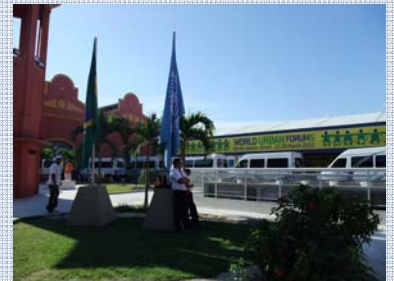
第5回世界都市フォーラム リオ・デ・ジャネイロ市、ブラジル (2010年3月22-26日)